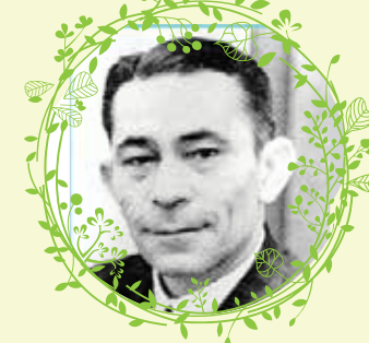
Cahit Sıtkı TARANCI

4 Ekim 1910'da Diyarbakır'da dünyaya geldi. Babası, Diyarbakır'da ticaret ve ziraatle uğraşan köklü Piriñçizadeler ailesinden Bekir Sıtkı Bey; annesi, babasının amca kızı Arife Hanım'dır. Ailesi, ona "Hüseyin Cahit" adını verdi. Akrabaların "Piriñçioğlu" soyadını aldığı halde Soyadı Kanunu çıktığı yıl piriñç ekiminden çok zarara uğrayan babası Bekir Sıtkı Bey, bu duruma kızarak Lisesi'ne gönderildi. Lise öğrenimi içinse Galatasaray Lisesi'ne geçti. Fransızca çok iyi öğrenerek Baudelaire, Rimbaud, Mallarmé'yi özümsemi. Şiir yazmaya lise yıllarında başladı. İlk şiirleri Galatasaray Lisesi'nin "Akademi" isimli dergisinde ve Servet-i Fünun dergisinde yayımlandı. Ömrü boyu yakın dostu olan Ziya Osman ile okul yıllarında tanıştı. 1931'de girdiği Mülkiye Mektebi'nden sevmeyişi için ikinci senenin sonunda atılınca Yüksek Ticaret Okulu'na girdi, ancak memuriyet sınavını kazanıp Sumerbank'ta çalışmaya başladıktan sonra bu okuldan da ayrılmak zorunda kaldı. "Ömrümde Süküt" adlı ilk şiir kitabı henüz Mülkiye Mektebi'nde iken yayımlandı. Karabük'e atanması üzerine Sumerbank'ta başladığı memuriyetten ayrıldı; çalışma hayatını öykülerini yayımlamakta olduğu Cumhuriyet Gazetesi'nde sürdürdü.